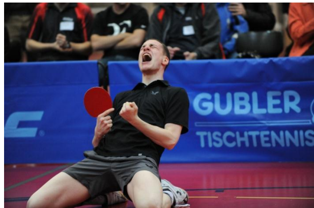
Siegesjubiläum nach Schweizermeistertitel im Einzel

Natürlich wird man für die schweisstreibende Arbeit auch belohnt und darf spezielle Erfahrungen machen. Denn einen Schweizermeistertitel erringen oder für die Nationalmannschaft antreten zu dürfen, sind Dinge, an welche man sich immer erinnern wird. Aus diesem Grund habe ich es bis anhin nicht bereut, diesen Weg gegangen zu sein. Tischtennis war stets eine grosse Bereicherung für mein Leben und eine gute Lebensschule. Wer aber Spitzensport wirklich betreiben möchte, der sollte sich immer bewusst sein, dass dies mit einem sehr grossen Aufwand verbunden ist und man auch auf viele Dinge verzichten muss. Die zahlreichen unvergesslichen Erlebnisse entschädigen aber die Entbehrungen.