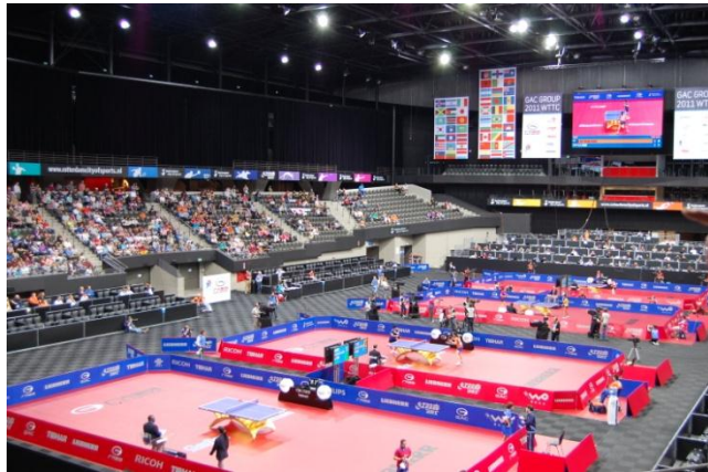
Haupthalle WM Rotterdam

Als derzeitige Weltnummer 385 nahm ich, wie bereits im Jahr 2009 in Yokohama, an den Einzel-Weltmeisterschaften in Rotterdam teil. Bereits in den Gruppenspielen musste ich hart kämpfen und wehrte im zweiten Spiel zwei Matchbälle ab, bevor ich mir den Gruppensieg mit einem 4:3-Sieg sichern konnte. In der anschliessenden Zwischenrunde spielte ich gegen die Weltnummer 239, gegen welche ich überraschend souverän mit 4:1 gewinnen konnte. In der zweiten und letzten Zwischenrunde musste ich mich dann leider der Weltnummer 201 geschlagen geben. Trotz dieser Niederlage war es eine erfolgreiche WM für mich, an welcher ich wieder einiges an Erfahrung mitnehmen konnte. Wie aber unschwer zu erkennen ist, besteht noch ein grosser Abstand zwischen mir und der Weltspitze und das trotz meines Trainingsaufwands.